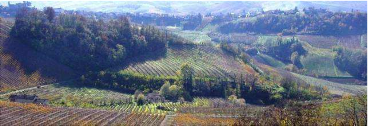
La colina de Mornico vista desde Castello