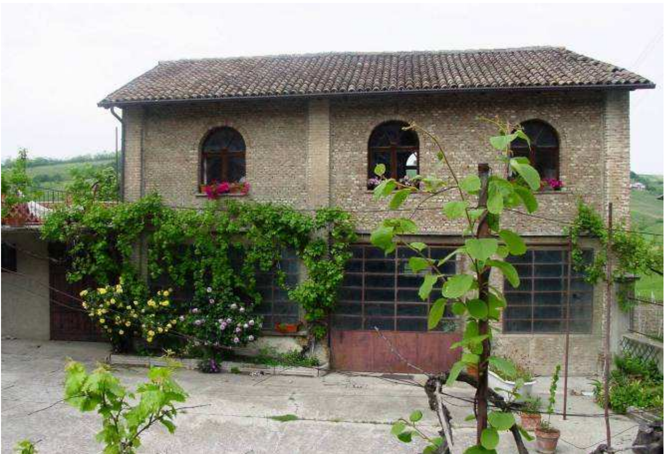
La entrada della vieja cantina

Hay muchas cosas para ver en los alrededores, como la magnífica Cartuja di Pavia o la poetica abadía de San Alberto. Se puede ir a las Termas de Salice y Rivanazzano y a la noche gozar de festivales y fiestas de verano, donde se podrán degustar deliciosos raviolos y beber la roja y burbujeante Bonarda .