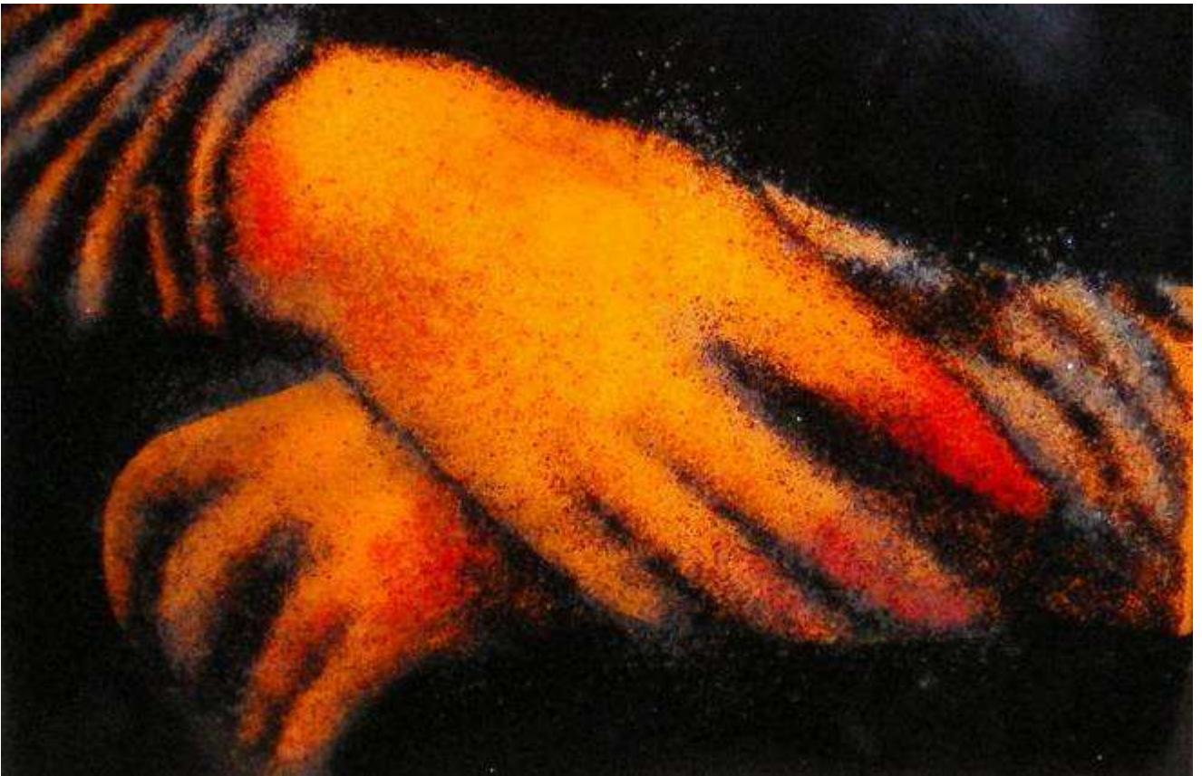
Ejercicio de Light Painting inspirado a Leonardo

Número de alumnos: Mínimo 4 , máximo 8 estudiantes.