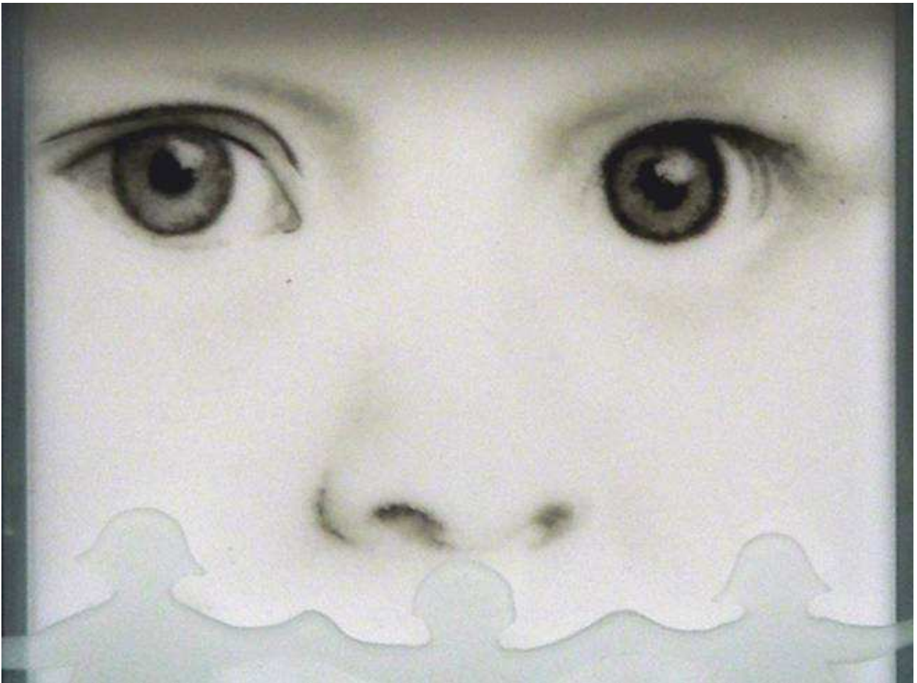
"Spring season"(detalle) Light-Painting con polvo de vidrio