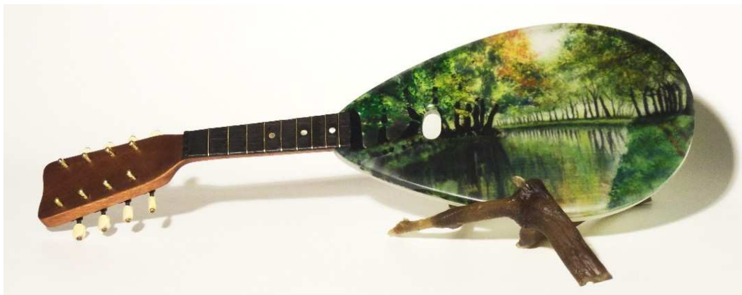
French Sweet memory, M. Di Fiore, 2011

Una giornata scelta dal gruppo sarà dedicata a visitare il nostro bellissimo territorio, per imparare anche come "guardare" il paesaggio e fotografarlo in funzione della nostra intensione di tradurlo in vetro.