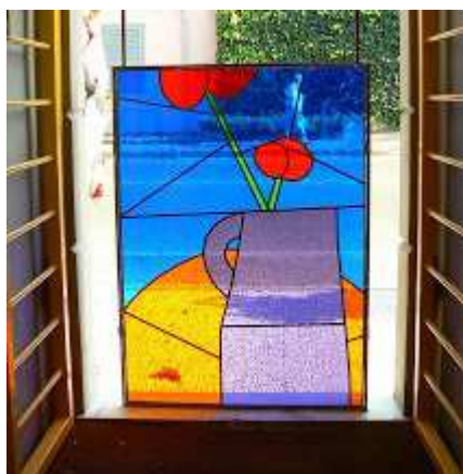
Vetrata su disegno di Emilio Tadini