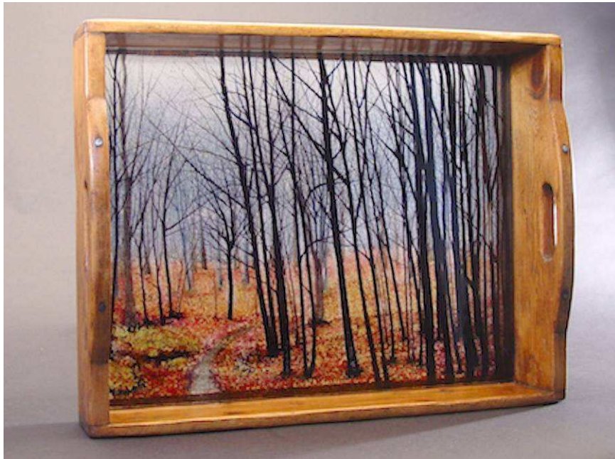
Miriam Di Fiore, "Vassoio in Autunno", 2007

Informazioni o prenotazioni turistiche per eventuali viaggi prima o dopo i corsi. (Possiamo soltanto segnalarvi un'Agenzia turistica in zona).