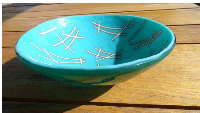
Ciotola, lavoro di un'allieva.

Una giornata a scelta del gruppo sarà dedicata alla visita del nostro bellissimo territorio.