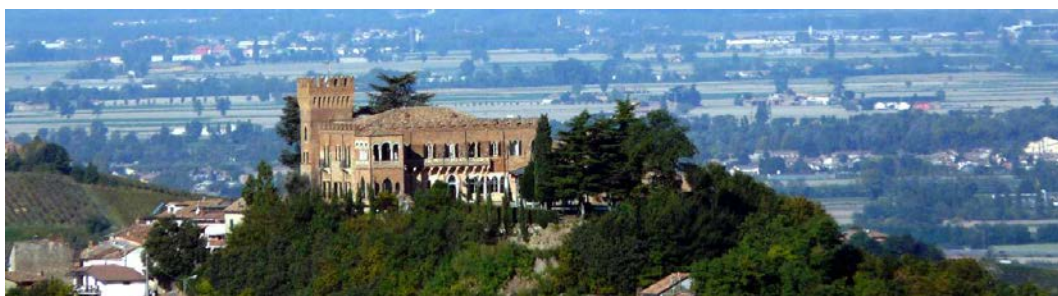
Castello di Mornico Losana

Una Camera costa 45 Euro con colazione..Possibile cenare.