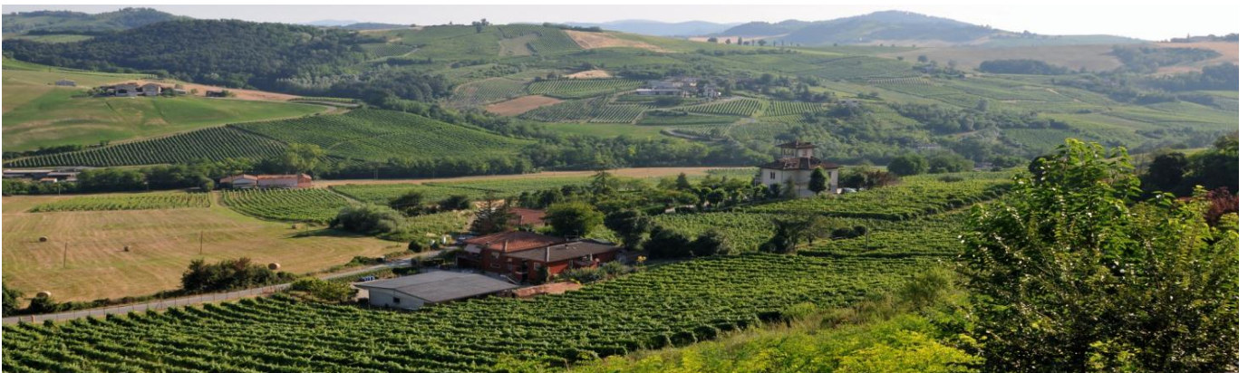
Vista desde casa Spiaggi

Las posibilidades de alojamiento en el pueblo son las siguientes: